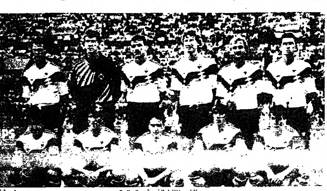
منتخب ألمانيا الغربية يبل العالم

ابرتت صحف ايطاليا الصادرة صباح امس الاثنين فوز ألمانيا الغربية بكأس العالم على الشكل الاتي: صحيفة «نوتوسبورت» قالت ان ما سجله لاعبو انترناسيونالي بريسيه هدف الفوز لألمانيا فان مستوى المباراة كان سيئا، لقد افسدها بسرعة السلوب العدواني للمجموع ورده فعل مارادونا كانت المباراة قليلا من اللعب وكثيرا من التفرقة.